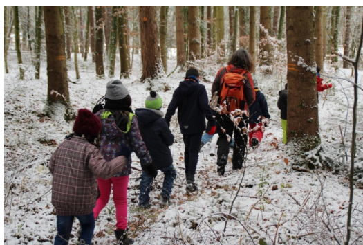
Abb. 16: Auf geht's zur Tierspurenuche!

Vielleicht finden die Kinder unterwegs auch Tierspuren wie Fußabdrücke, Spechtlöcher oder angenagte Zweige? Wie sehen ihre Urheber aus und wie heißen sie?