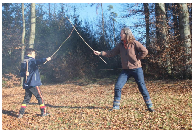
Abb. 14: Kämpfen mit Stöcken und klaren Regeln

Fazit: Kurze Sequenzen, viele Bewegungspausen und methodische Abwechslung entsprechen den Bedürfnissen der Kinder.