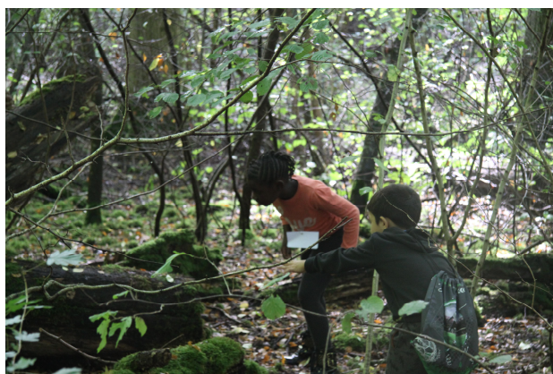
Abb. 2: Pustebblumen gibt es auch in Syrien.