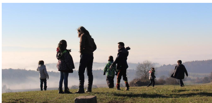
Abb. 22: Da unten wohnen wir!

Wann gehen wir wieder in den Wald? Gern möchten wir dieses Projekt fortführen, und wir freuen uns, wenn diese Broschüre dazu beiträgt, auch an anderen Orten Flüchtlingskinder in die Natur zu locken.