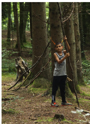
Abb. 8: Beim Hüttenbau

Immer wieder wurden auch kleine Hütten aus Ästen gebaut, und die Kinder haben sich gern darin in kleinen Gruppen zurückgezogen . vielleicht auch ein Ausdruck von sich schaffe mir meinen Platz%?