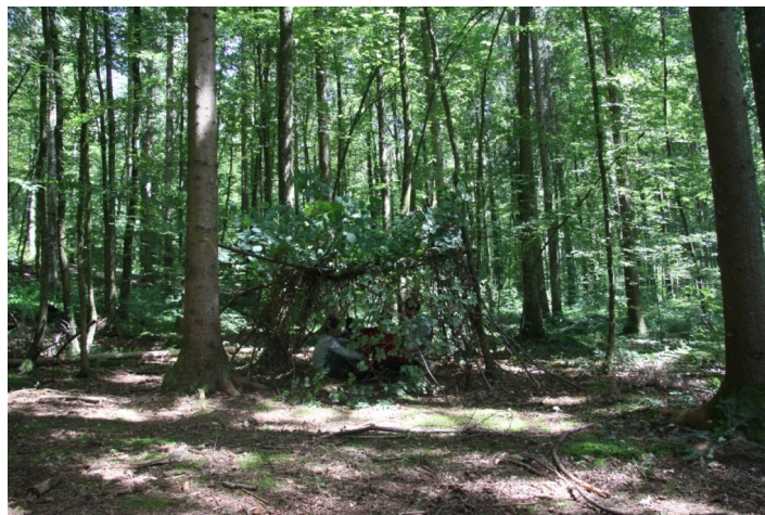
Abb. 9: Unsere Hütte ist fertig.