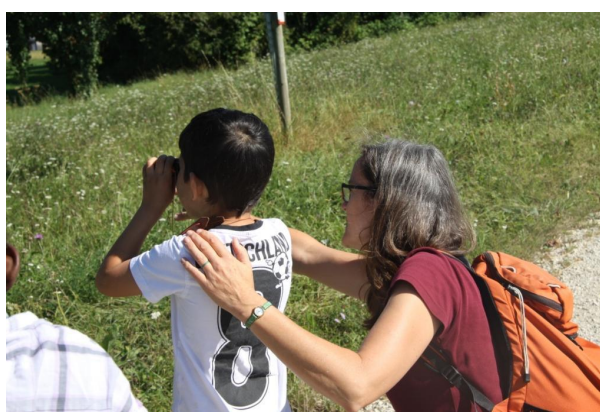
Abb. 11: Der Umgang mit dem Fernglas will geübt sein.