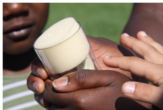
Abb. 5: Schatten für den Schmetterling