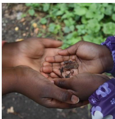
Abb. 10: Ich den Frosch?