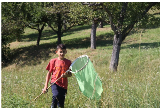
Abb. 4: Auf der Suche nach Schmetterlingen

Auf der Streuobstwiese wurden die Schmetterlinge erkundet. Und ganz nebenbei lernten die Kinder die gerade reifen Obstsorten wie Zwetschgen, Zibaten und Mirabellen kennen und lieben. Sehr begehrt waren das Fernglas und die Lupe, durch die die meisten von ihnen zum ersten Mal in ihrem Leben schauten.