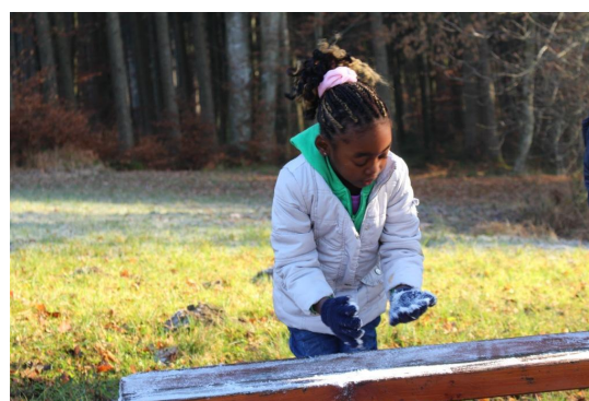
Abb. 13: Warm gekleidet beim ersten Raureif