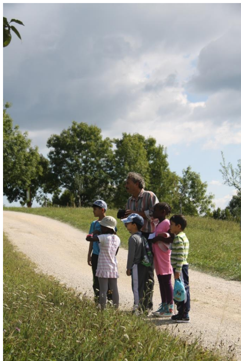
Abb. 15: Insbesondere die Jungs fanden es klasse, als auch Männer als Begleitung dabei waren!

Fazit: Je nach Anzahl der Kinder sollten mindestens zwei bis drei Erwachsene die Gruppe begleiten.