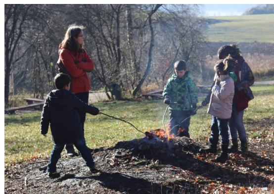
Abb. 20: Ein wärmendes Feuer