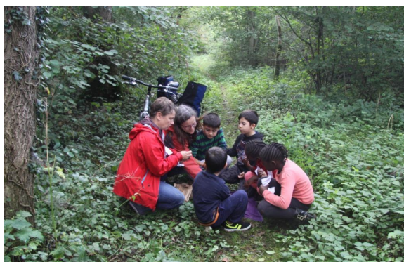
Abb. 12: Vesperpause

Folgendes sollten die Begleiter immer dabei haben: Erste-Hilfe-Tasche, Pfeife (um Kinder zurückholen zu können), eventuell ein insektenabwehrendes Mittel, Becherlupen sowie Trinken, Becher und eine Kleinigkeit zu essen für alle. Ein Ball oder eine Frisbyscheibe schaffen zwischendurch Bewegung, und gern arbeiteten unsere Kinder mit Messer, Klappsäge, Feile und Handbohrer . aus Sicherheitsgründen natürlich nur unter Aufsicht! Ein Buch mit vielen Tierabbildungen zum Nachschlagen hilft sich zu verständigen, wenn Tiere oder ihre Spuren entdeckt werden.