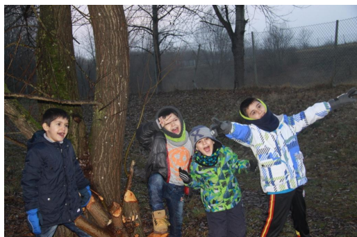
Abb. 6: Juchuh, Biberspur gefunden!

Im BUND-Naturschutzzentrum bestaunten wir außerdem Präparate vom Rehkitz, Maulwurf, Igel und Fuchs. Das war für manche Kinder unheimlich (sechte Tiere?) aber für alle sehr spannend, denn gerade diese Tierarten waren vorher öfter im Gespräch.