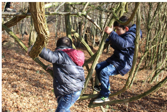
Abb. 19: Eine Kletterpause zwischendurch

Hinweis: Die letzten vier Spiele erfordern das Einhalten von Regeln und funktionieren nur, wenn die Kinder sie verstanden haben. Wenn das Erklären aus sprachlichen Gründen schwierig ist, geht es auch mit „learning by doing“ und braucht nur vielleicht etwas länger. Fast alle Kinderspiele lassen sich übrigens mit ein wenig Fantasie abwandeln und mit Naturinhalten füllen!