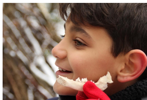
Abb. 17: „Wenn ich ein Fuchs wäre!“