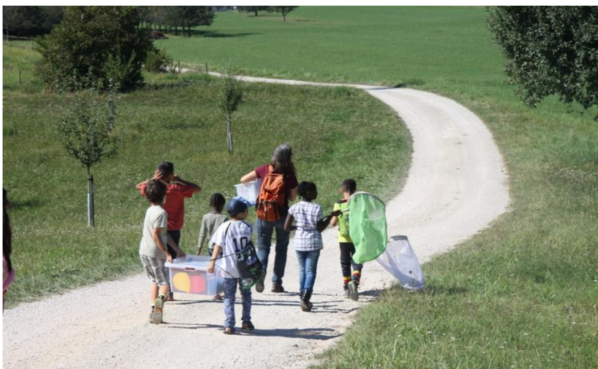
Abb. 1: Aufbruch zum Schmetterlingsausflug

Um gut auf ihre Bedürfnisse eingehen zu können, Konfliktsituationen zu meistern und die Gruppe beisammen halten zu können, waren meist drei Erwachsene und auch jugendliche Begleiter dabei.