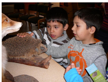
Abb. 7: Auge in Auge mit Fuchs und Igel