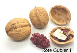
Rote Gubler 1