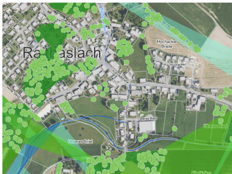
Abb. Lage des geplanten Wohngebiets (LUBW Kartendienst)

Die Stellungnahme des BUND und NABU erfolgt im Namen des BUND Landesverbands Baden-Württemberg e.V. und des Naturschutzbund Deutschland Landesverband Baden-Württemberg e.V.. Die LNV-Stellungnahme erfolgt zugleich im Namen aller nach § 3 Umweltrechtsbehelfsgesetz (UmwRG) anerkannten Naturschutzvereinigungen: AG "Die NaturFreunde" Baden-Württemberg (NF), AG Fledermausschutz Baden-Württemberg e.V. (AGF), Bund für Umwelt- und Naturschutz Deutschland (BUND), Deutscher Alpenverein (DAV), Landesfischereiverband Baden-Württemberg (LFV), Landesjagdverband Baden-Württemberg (LJV), Naturschutzbund Deutschland (NABU), Schutzgemeinschaft Deutscher Wald (SDW), Schwäbischer Albverein (SAV) und Schwarzwaldverein (SWV).